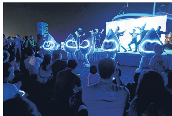
省水大使“活力水”(Water Wally)在昨晚的世界水日夜间嘉年华上表演，五个圆滚滚的水滴随着音乐摇摆。