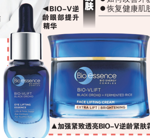
加强紧致透亮BIO-V逆龄紧致霜