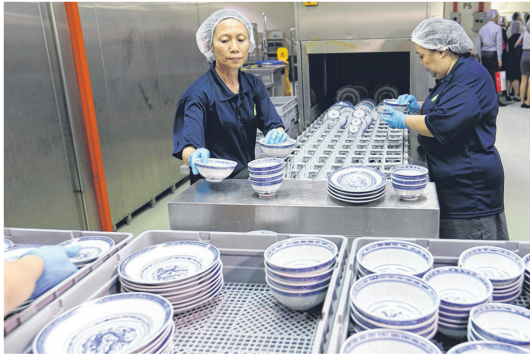
设在樟宜机场第三搭客大厦的中央洗碗处，由商业碗盘清洁公司伟盛 (GreatSolutions) 运营。(档案照)