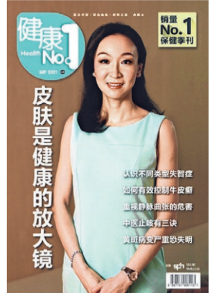
第48期《健康No.1》探讨多种常见的病况。

风筒或热水来止痒，或用苹果醋或白醋“消毒”，郭医生提醒，这些做法只会加剧发炎状况，伤害皮肤表层。